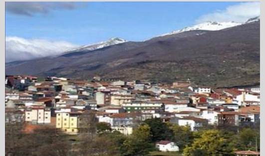
Cabezuela del Valle (Jerte)