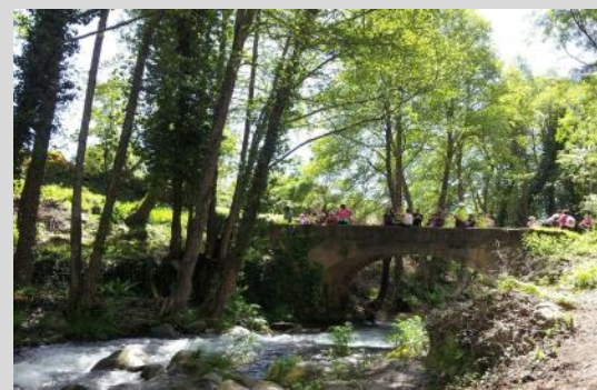
Gargantas de La Vera