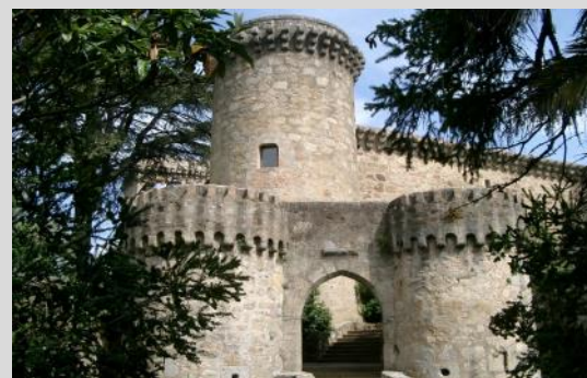
Castillo parador Jarandilla