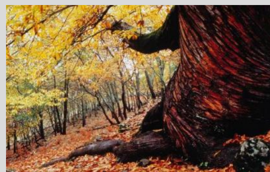
Castañares de Ambroz