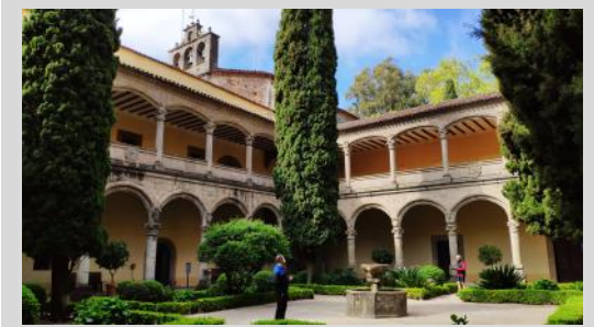
Monasterio de Yuste

* Muy importante: en caso que necesites conectar con otro servicio de transporte de vuelta a tu ciudad de origen, por favor muy importante, estima una diferencia de al menos 2 horas para evitar cualquier tipo de retraso en nuestra llegada.