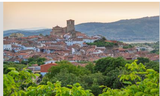
Hervás (Valle de Ambroz)